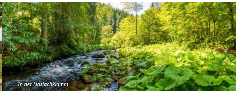
In der Haslachklamm