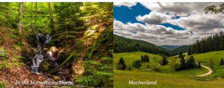
In der Hohwehraschlucht