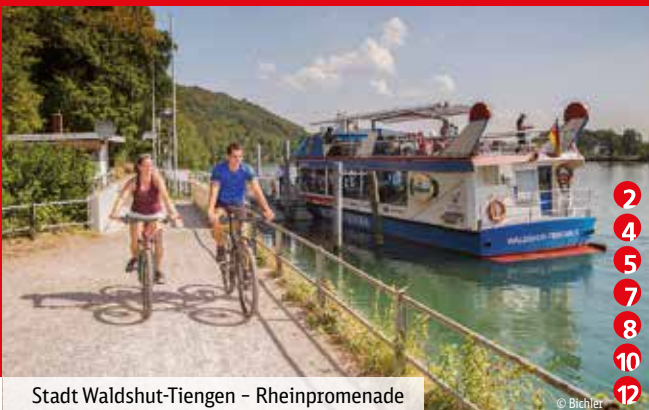
Stadt Waldshut-Tiengen – Rheinpromenade