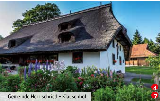
Gemeinde Herrschried – Klausenhof