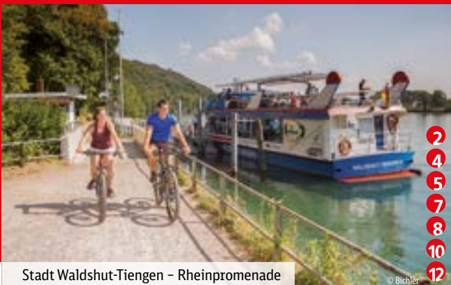
Stadt Waldshut-Tiengen – Rheinpromenade