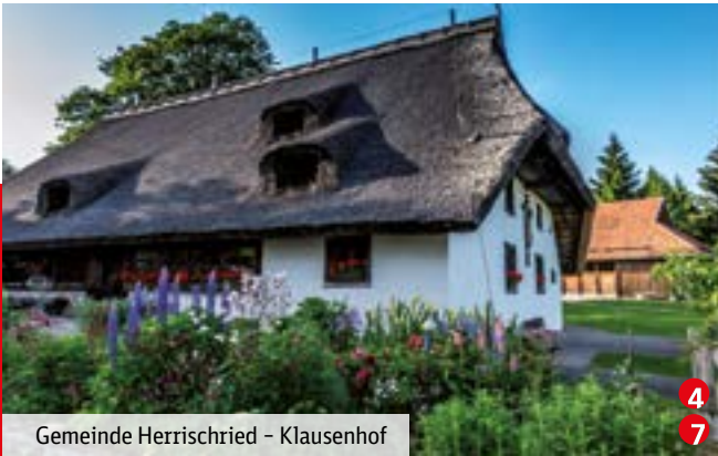
Gemeinde Herrischried – Klausenhof