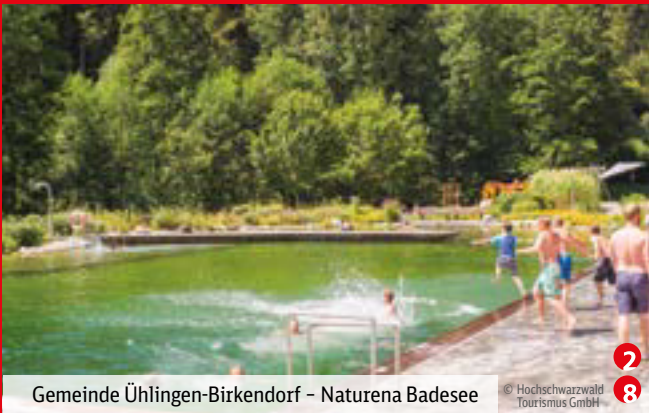
Gemeinde Ühlingen-Birkendorf – Naturena Badesee