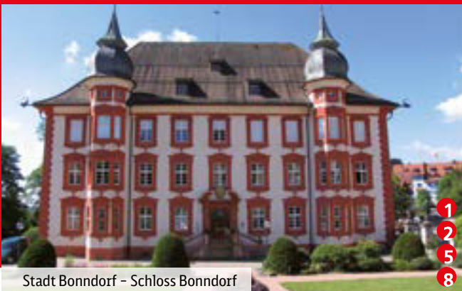
Stadt Bonndorf – Schloss Bonndorf