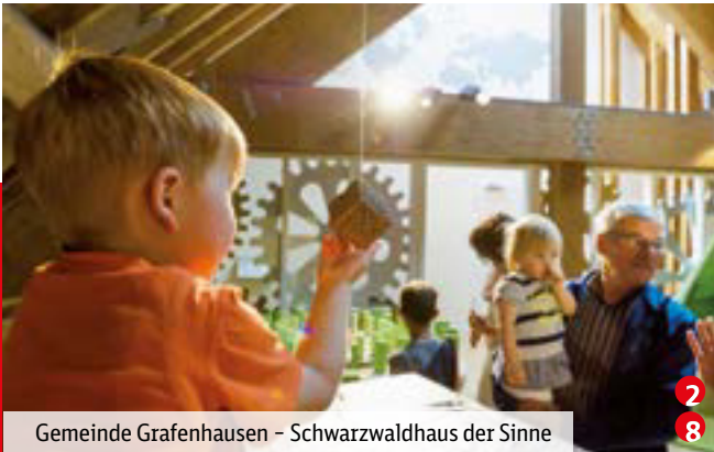
Gemeinde Grafenhausen – Schwarzwaldhaus der Sinne