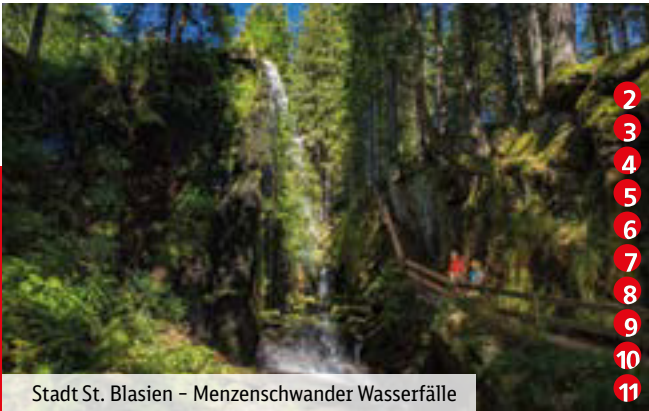
Stadt St. Blasien – Menzenschwander Wasserfälle