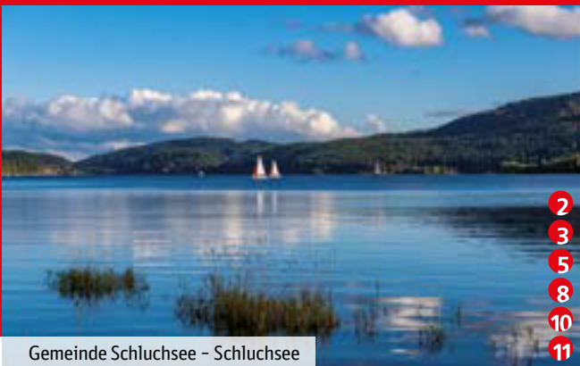
Gemeinde Schluchsee – Schluchsee