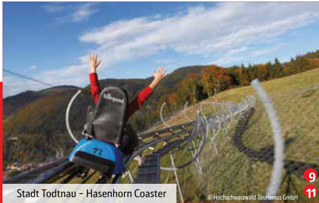
Stadt Todtnau – Hasenhorn Coaster