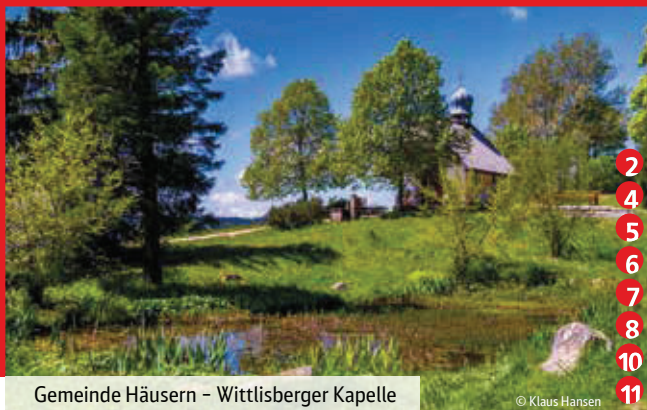
Gemeinde Häusern – Wittlisberger Kapelle