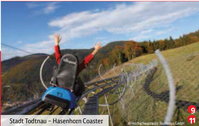
Stadt Todtnau - Hasenhorn Coaster