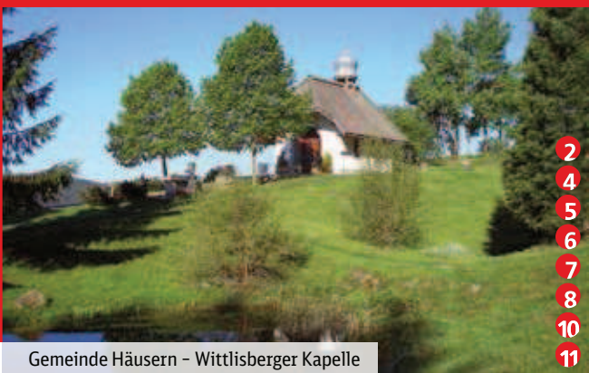
Gemeinde Häusern - Wittlisberger Kapelle