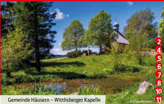
Gemeinde Häusern – Wittlisberger Kapelle