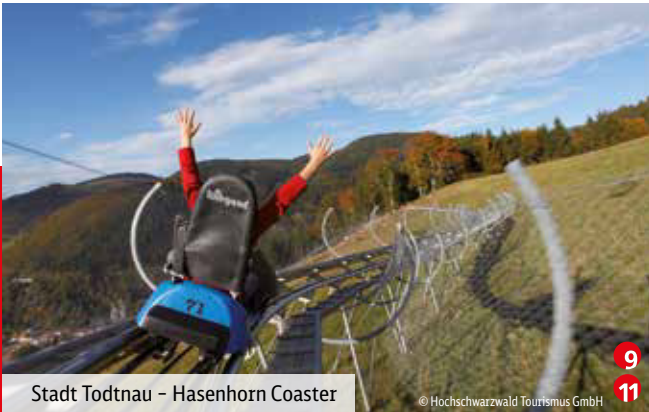
Stadt Todtnau – Hasenhorn Coaster