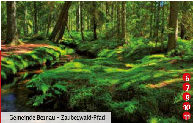
Gemeinde Bernau – Zauberwald-Pfad