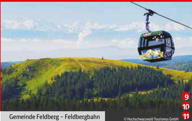
Gemeinde Feldberg – Feldbergbahn