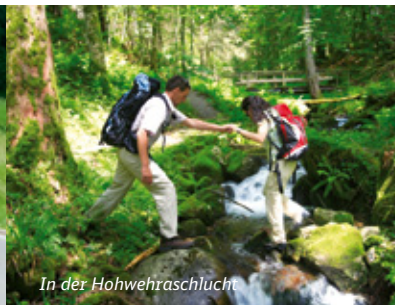
In der Hohwehraschlucht