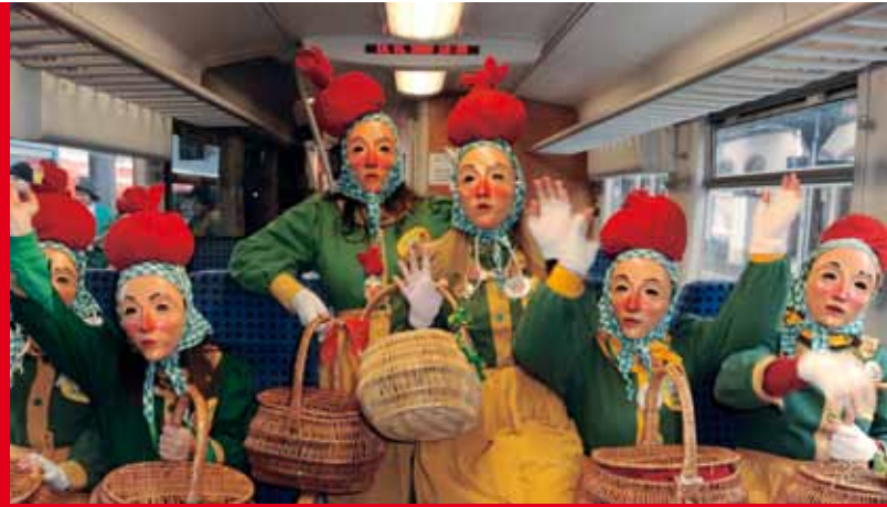
Tradition & Brauchtum