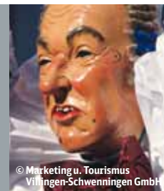
© Marketing u. Tourismus Villingen-Schwenningen GmbH