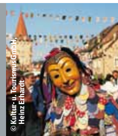
© Kultur- u. Tourismus GmbH, Heinz Erhardt