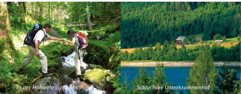
In der Hohwehrschlucht