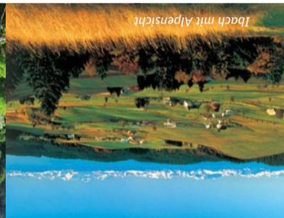
Ibach mit Alpensicht