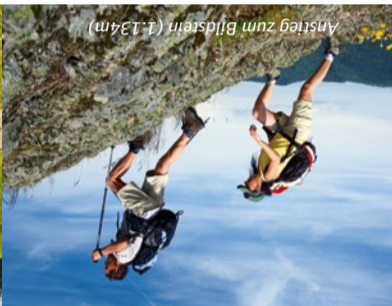
Anstieg zum Bildstein (1.134m)